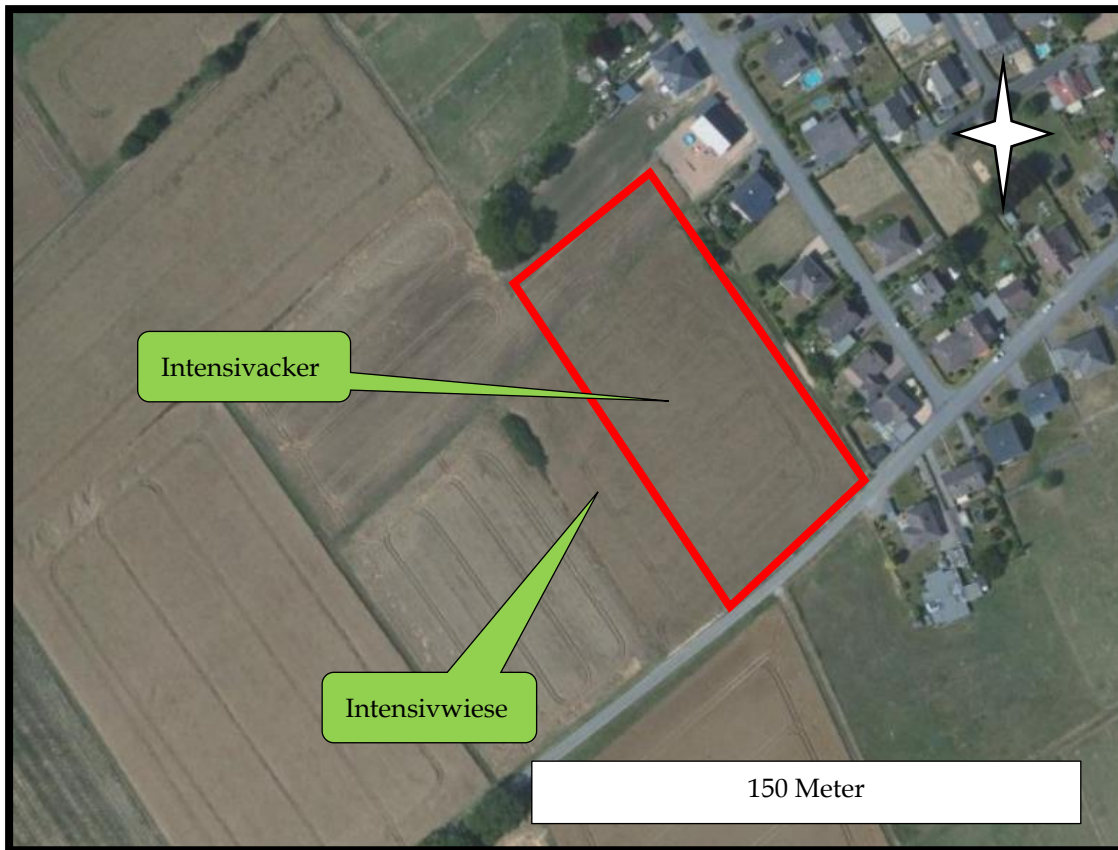
Abb. 2: Lage des Plangebietes in Großmaischeld (nicht exakt; vgl. Abb. 3)