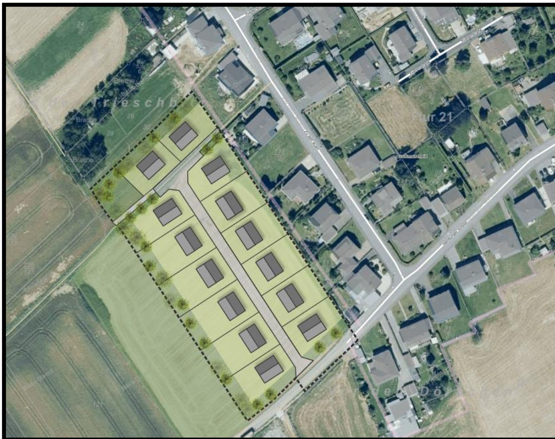
Abb. 3: Bebauungsplan „Zu den Auen“.