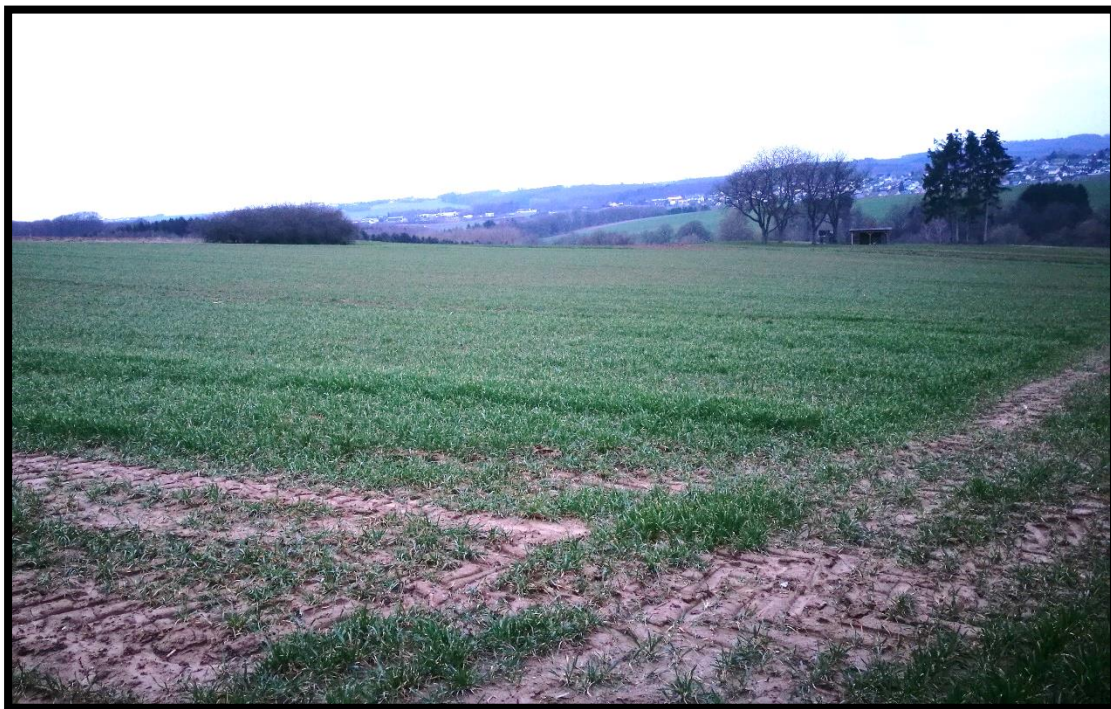
Bild oben: Intensivacker im Plangebiet; Blick nach Norden Bild unten: Intensivacker im Plangebiet; Blick nach Nordwesten